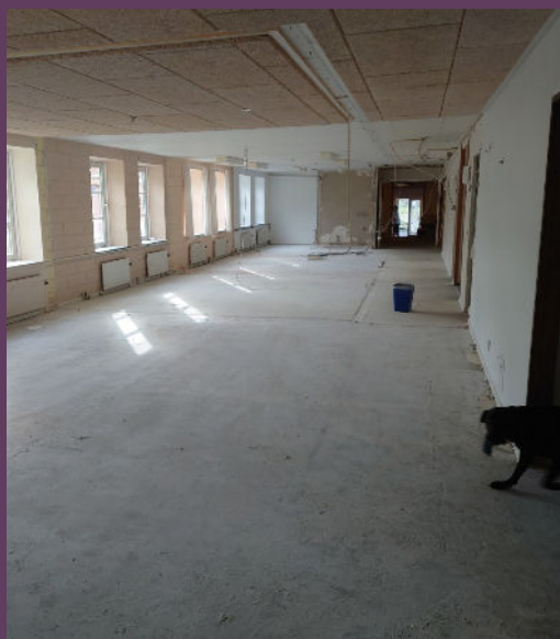
væggene er blevet væltet, og lyset strømmer ind i den nye dagligstue