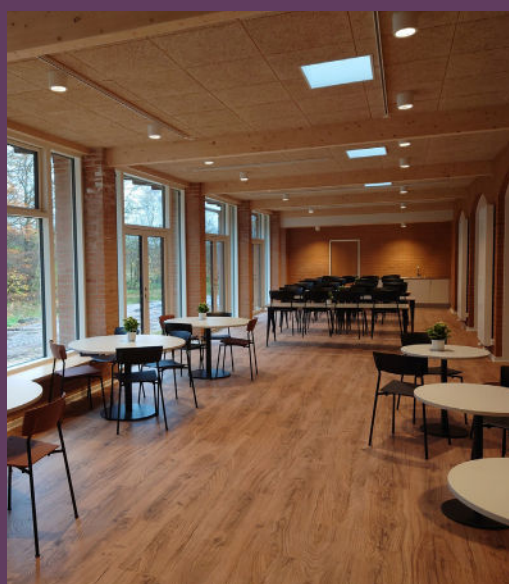
Spisesalen efter ombygningen