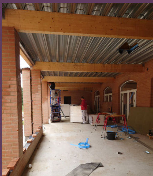
Spisesalen under ombygningen