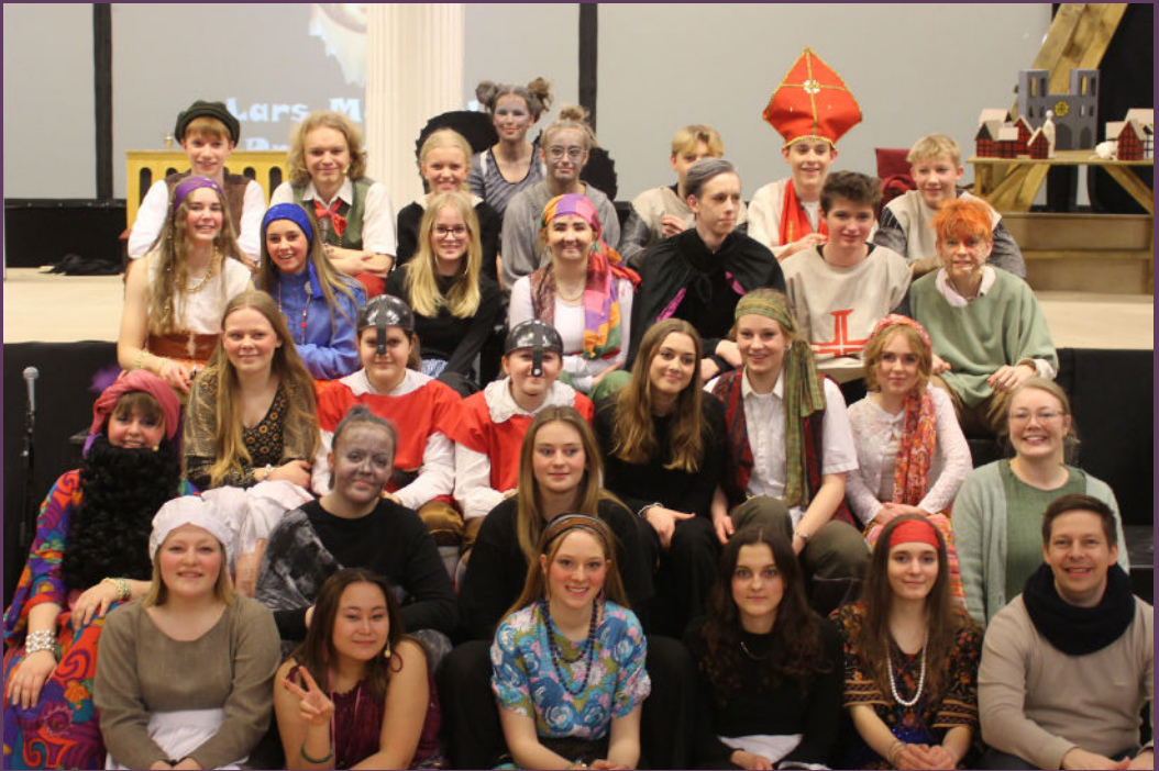
Et lille indblik i forberedelserne til årtes musical