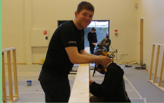
Scenen bliver bygget op fra bunden

I starten af ugen følte projektet helt uoverskueligt, men til sidst faldt alle brikkerne på plads, og vi lavede 3 forestillinger. Første forestilling blev vist fredag morgen for skoleelever fra omegnen. Om aftenen samme dag gik det helt store show i gang, hvor der var åbent hus, så alle der havde lyst, kunne komme og se med. Lørdag blev forestillingen for sidste gang vist for forældre, søskende og kommende elever, i forbindelse med kommende elevers introdag. Alle forestillingerne blev live-streamet og ligger nu på YouTube.