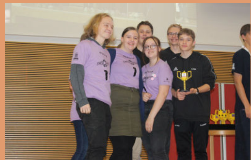
Vi får overrakt pokalen for 3. pladsen i teknologi