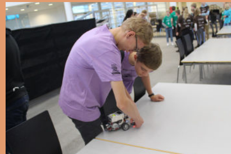
Vi gør robotten klar til første kørsel