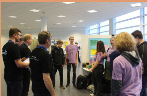
Vi fortæller om sammenholdet på vores hold