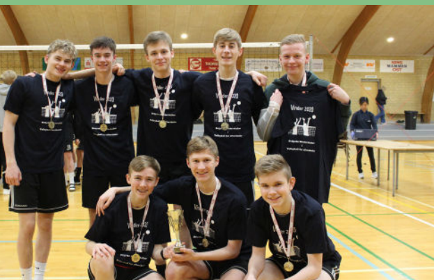
Guld til drengenes 1. hold

Sidst i februar deltog vi i ØM i volley. Vi havde fire drengehold og fire pigehold med. Så de fleste af skolens elever var aktive på banen, og de sidste var med som heppekor. Både drengene og pigerne kom i finalen i A-rækken, hvor der kæmpes om at gå videre til DM i volley. Efter to meget intense kampe stod det klart, at i år var det drengene der med en guldmedalje også kvalificerede sig til DM (som så desværre blev aflyst). Men også alle de andre hold kæmpede og fik masser af flot spil i spændende kampe i B-rækken. Volley-kulturen på Hedemølle har givet mange elever masser af bold-glæde!