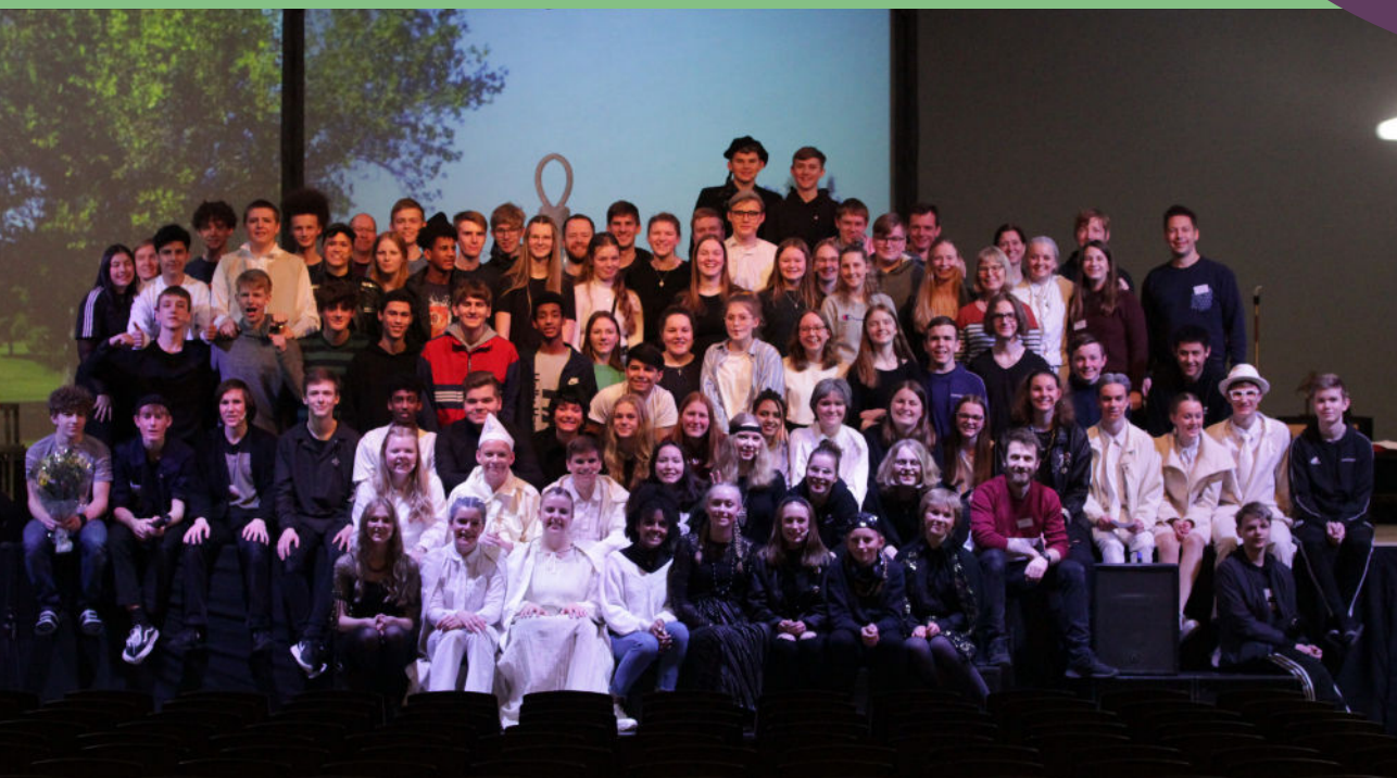
Hele den skønne flok efter nogle vellykkede forestillinger